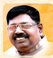
டாக்டர் ஒ. ரவி முதல்வர்